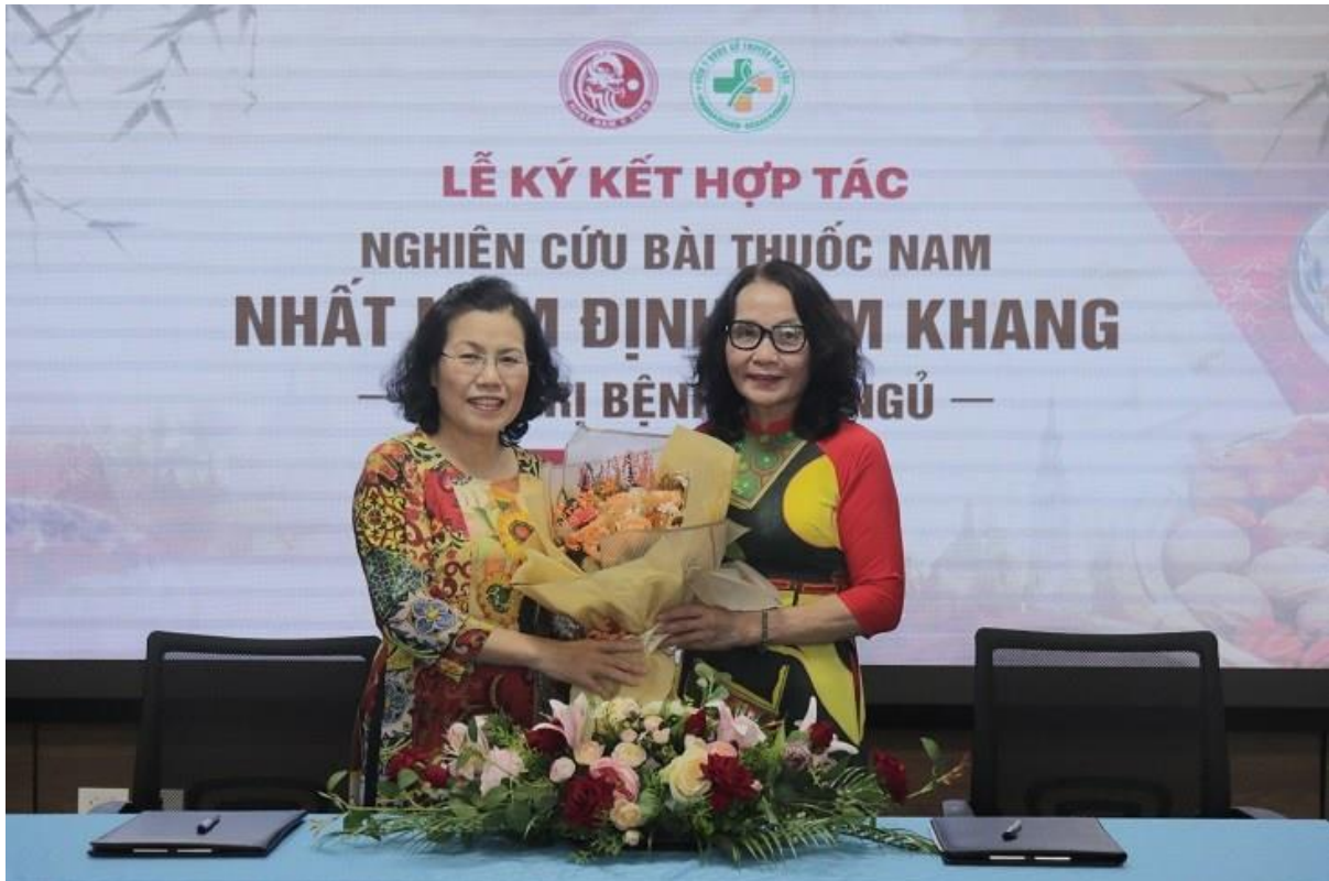
Lễ ký kết hợp tác giữa hai đơn vị đầu ngành YHCT