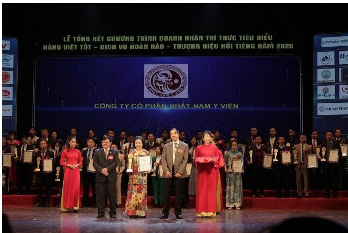
Nhất Nam Y Viện nhận giải thưởng vào năm 2020

Đi theo hướng phục dựng lại những giá trị YHCT Cung Đình Huế, đem lại nhiều giá trị cho cộng đồng, Nhất Nam Y Viện đã đạt được nhiều thành công trong điều trị bệnh, tạo được tiếng vang lớn trong nền YHCT nước nhà. Nhờ vậy, Nhất Nam Y Viện liên tục được giới chuyên gia YHCT đánh giá cao cùng các trang báo chí, chương trình truyền hình đưa tin về phương pháp chữa bệnh độc đáo, hiệu quả này. Đặc biệt, vào năm 2020, Nhất Nam Y Viện đã vinh dự nhận giải thưởng “Top 20 thương hiệu nổi tiếng nhất Việt Nam” .