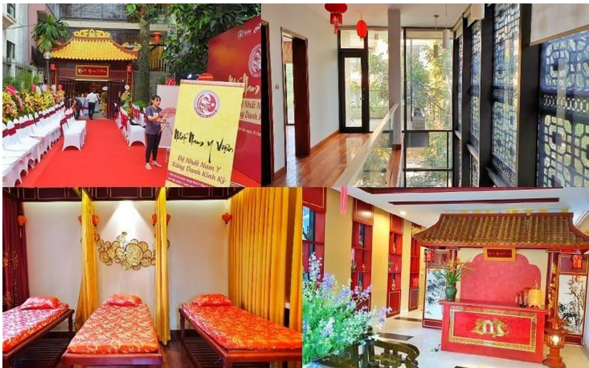
Nhất Nam Y Viện là đơn vị đầu tiên phục dựng lại nguyên vẹn tinh hoa YHCT triều Nguyễn

Ngoài lối kiến trúc mang đậm dấu ấn của Hoàng Cung triều Nguyễn, người bệnh sẽ được trải nghiệm cách khám bệnh từ YHCT từ bắt mạch, kê đơn, bốc thuốc và đều đạt hiệu quả ngoài mong đợi.