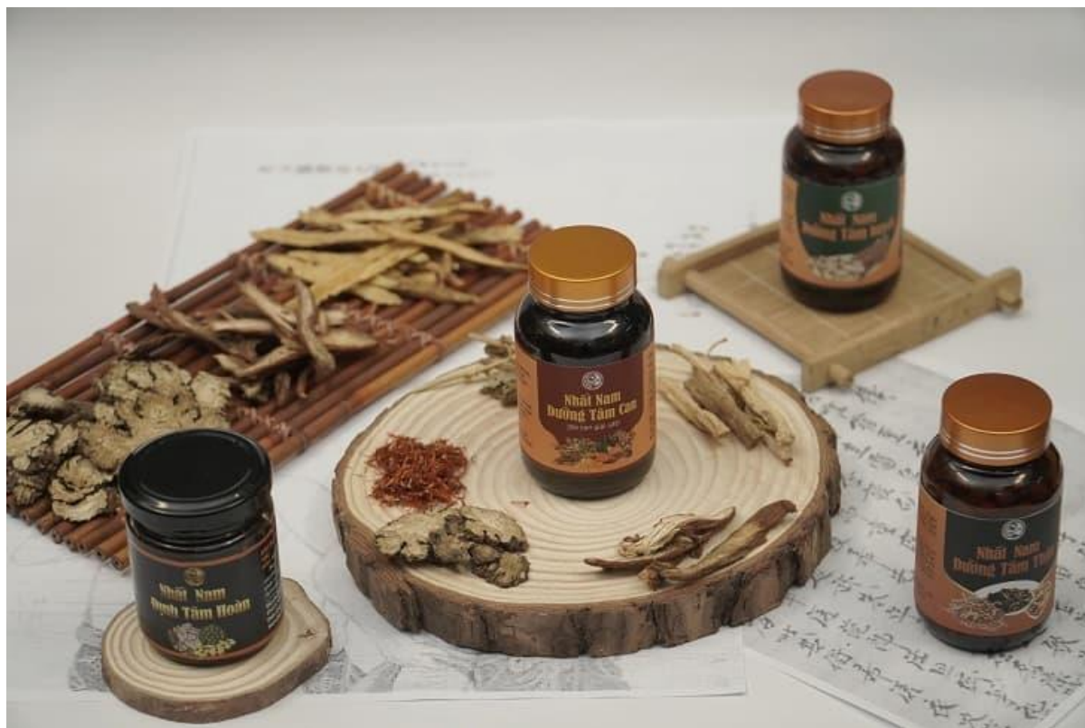
Bài thuốc Nhất Nam Định Tâm Khang

Thành phần bài thuốc Nhất Nam Định Tâm Khang kết hợp hơn 30 loại thảo dược tốt bậc nhất trong điều trị mất ngủ, an thần, bổ khí huyết. Trong đó, có rất nhiều vị thuốc quý mà chỉ có các đời vua chúa xưa mới được sử dụng như: Bá tử nhân, Đẳng sâm, Táo nhân, Hoàng kỳ, Phù tiểu mạch, Sài Hồ, Lạc tiên, Chỉ xác, Uất kim, Đương quy, Táo Nhân, Viễn chí,... Các vị thuốc được phối kết hợp đặc biệt theo đúng nguyên tắc Y học cổ truyền, 100% dược liệu đạt chuẩn GACP – WHO an toàn, không gây ra tác dụng phụ khi bệnh nhân sử dụng.